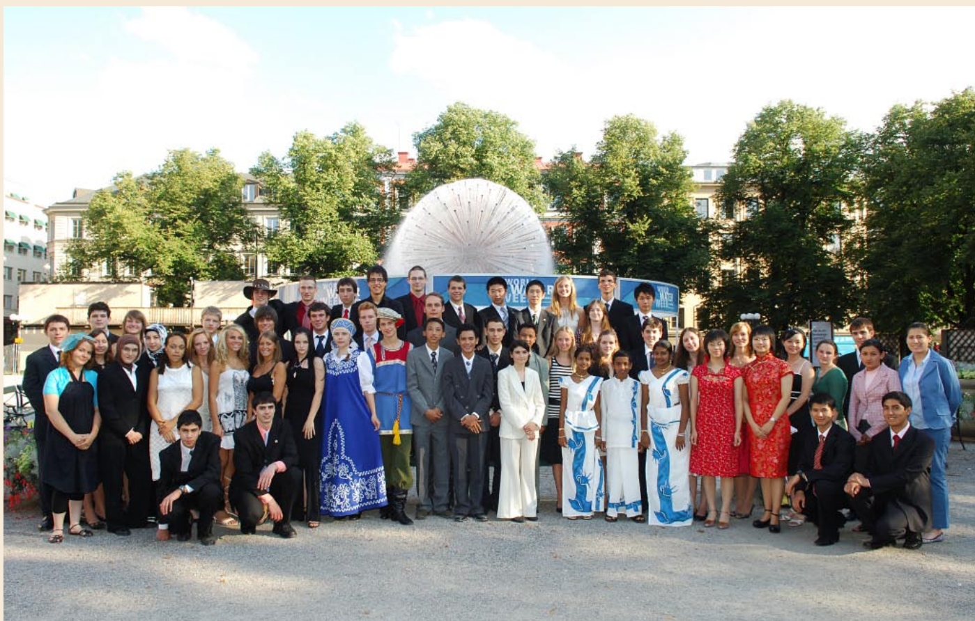
Účastníci SJWP 2007

Z prihlásených projektov vyberie odborná komisia (zložená z popredných výskumníkov a technológov z oblasti hydrológie a vodného hospodárstva) maximálne päťdesiat, ktorých autori dostanú možnosť predstaviť svoje originálne riešenia počas národného finále, ktoré sa uskutoční začiatkom júna vo Vodárenskom múzeu v Bratislave za prítomnosti širokej odbornej aj laickej verejnosti. Víťazný projekt národnej súťaže ocení Brati-