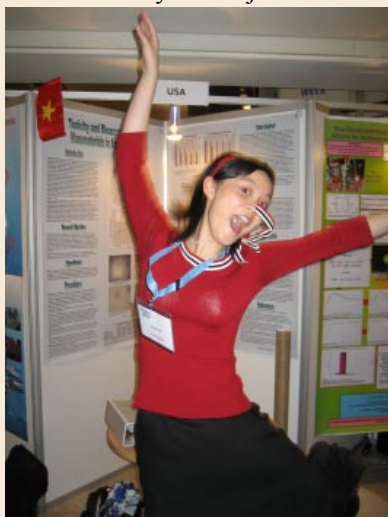
Súťažiaca pred svojím projektom

Občianske združenie Mladí vedci Slovenska a Bratislavská vodárenská spoločnosť, a. s., organizujú v školskom roku 2007/2008 1. ročník celoštátnej postupovej súťaže v oblasti problematiky vody „Stockholm Junior Water Prize – Cena Bratislavskej vodárenskej spoločnosti (BVS) za najlepší vodohospodársky študentský projekt“. Do súťaže sa môžu zapojiť študenti všetkých typov stredných škôl vo veku od 15 do 20 rokov. Ocenení budú nielen víťazi spomedzi študentov, ale aj školy a pedagógovia, ktorí budú podporovať študentov. Poslaním súťaže je zvýšiť záujem mladých ľudí o ochranu vôd, hospodárenie s vodou a manažment vodných zdrojov.