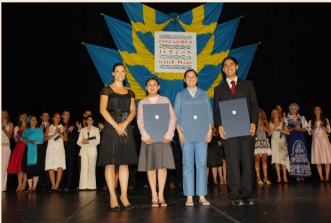
Korunná princezná Viktória s víťazmi 10. ročníka SJWP – súťažným tímom z Mexika

slavská vodárenská spoločnosť „Cenu BVS za najlepší vodohospodársky študentský projekt“. Zároveň autori projektu postupujú na celosvetové finále SJWP. Okrem hlavnej ceny môžu študenti v národnej súťaži vyhrať aj ďalšie mimoriadne zaujímavé ceny – napr. účasť na medzinárodnej letnej škole ekologov a rôzne ďalšie vecné a finančné ocenenia.