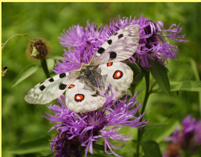
Jasoň červenooký – lietajúci skvost našej prírody