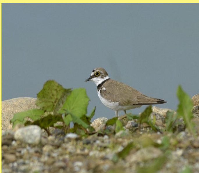
Operence okolo nás