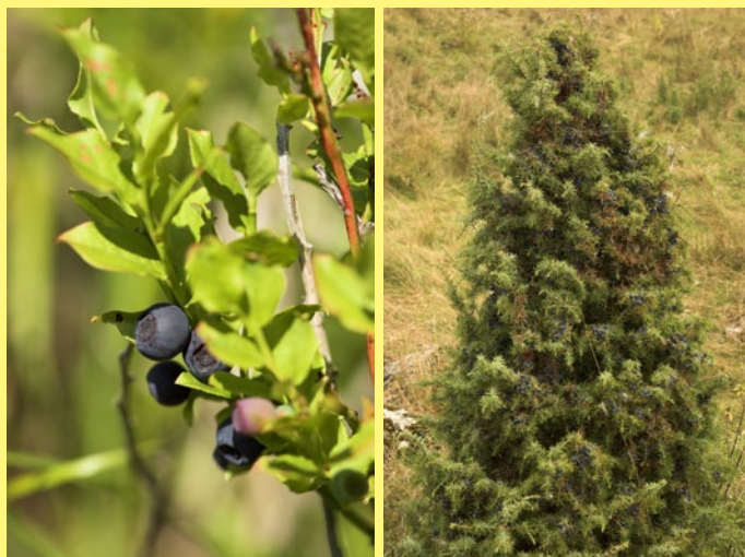
Rastliny okolo nás