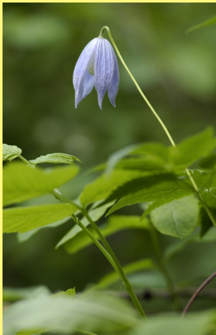
Skvosty v rastlinnej ríši