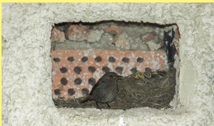
Operence okolo nás