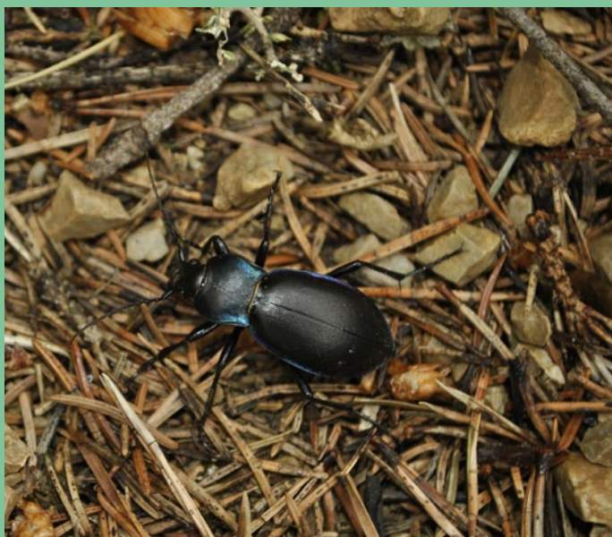
Bystruška fialová ( Carabus violaceus )