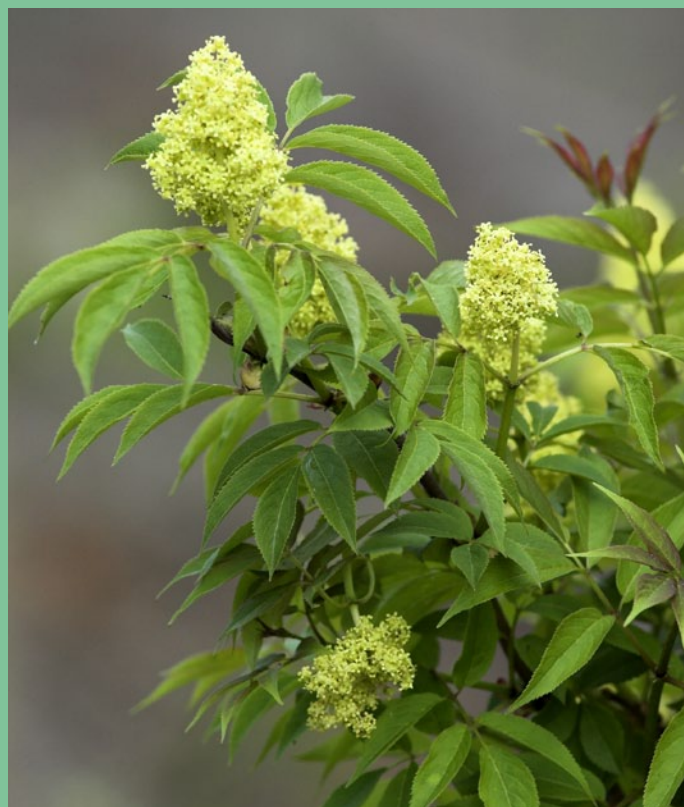
Baza červená ( Sambucus racemosa )