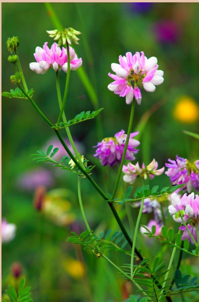
Ranostaj pestrý ( Securigera varia )