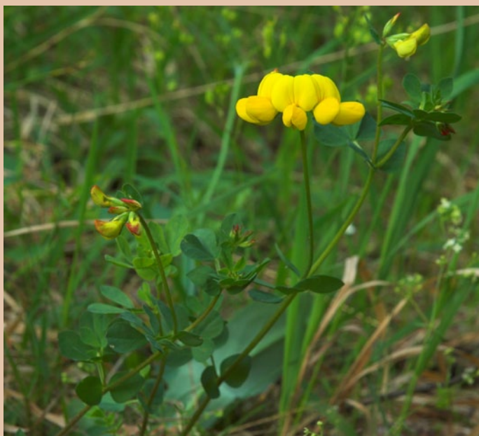
Ľadenec rožkatý ( Lotus corniculatus )