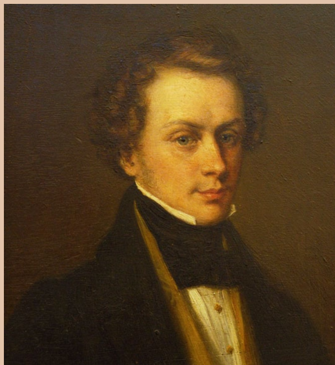
Christian Andreas Doppler – našiel spôsob, ako merať pozemské i vesmírne rýchlosti